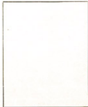
Fotografía tomada en el mes de ..... de 1.....