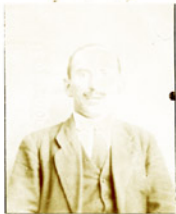
Fotografía tomada en el mes de ..... de 1.....