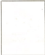
Fotografía tomada en el mes de ..... de 1.....