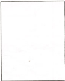
Fotografía tomada en el mes de _____ de 1 _____