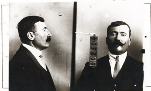
Fotografía tomada en el mes de _____ de 1 _____