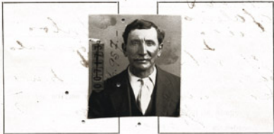
Fotografia tomada en el mes de ..... de 19.....

Prontuario refundido. vacante el 1779 sin antecedentes - 2078734 - 1779