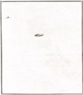
Fotografia tomada en el mes de ..... de 19.....