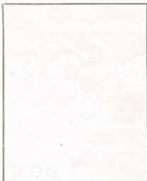
Fotografía tomada en el mes de _____ de 1 _____