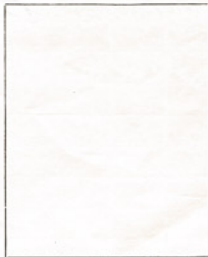
Fotografía tomada en el mes de _____ de 1 _____