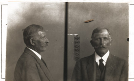
Fotografía tomada en el mes de _____ de 1 _____