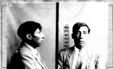
Fotografía tomada en el mes de _____ de 1 _____