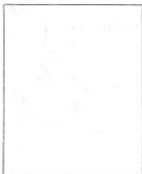
Fotografía tomada en el mes de ..... de 1.....