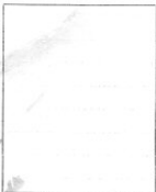
Fotografía tomada en el mes de ..... de 1.....