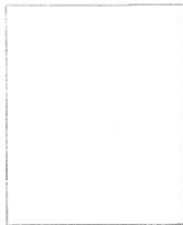
Fotografía tomada en el mes de _____ de 1 _____