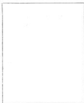
Fotografía tomada en el mes de _____ de 1 _____