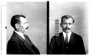
Fotografía tomada en el mes de _____ de 1 _____