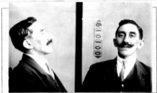
Fotografía tomada en el mes de _____ de 1 _____