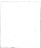
Fotografía tomada, en el mes de..... de 1.....