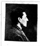
Fotografía tomada en el mes de..... de 1.....