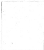
Fotografía tomada en el mes de..... de 1.....