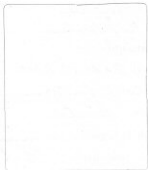
Fotografía tomada en el mes de Setiembre 1 o de 1925