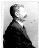
Fotografía tomada en el mes de _____ de 1 _____