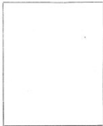
Fotografía tomada en el mes de ..... de 1.....