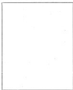
Fotografía tomada en el mes de ..... de 1.....