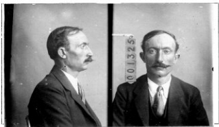
Fotografía tomada en el mes de ..... de 1.....