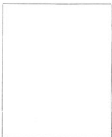
Fotografía tomada en el mes de ..... de 1.....