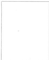
Fotografía tomada en el mes de ..... de 1.....