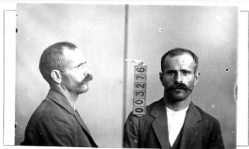
Fotografía tomada en el mes de ..... de 1.....