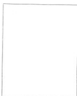
Fotografía tomada en el mes de _____ de 1 _____