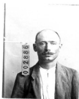
Fotografía tomada en el mes de _____ de 1 _____