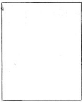
Fotografía tomada en el mes de _____ de 1 _____