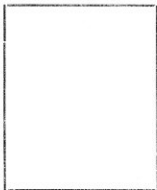
Fotografía tomada en el mes de Diciembre 15 de 192 4