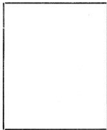
Fotografía tomada en el mes de _____ de 192_____