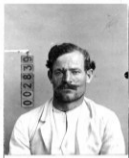
Fotografía tomada en el mes de ..... de 1.....