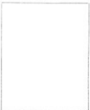
Fotografía tomada en el mes de ..... de 1.....