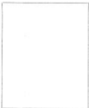
Fotografía tomada en el mes de ..... de 1.....