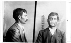
Fotografía tomada en el mes de _____ de 1 _____