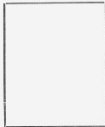
Fotografía tomada en el mes de _____ de 192_____