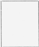
Fotografía tomada en el mes de Noviembre 25 de 19 24