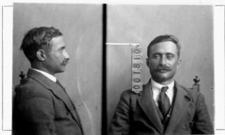
Fotografía tomada en el mes de ..... de 1.....