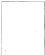
Fotografía tomada en el mes de ..... de 1.....