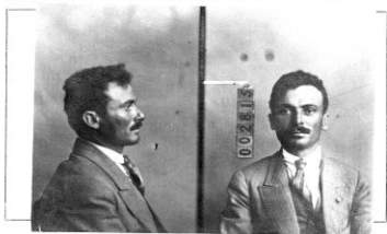
Fotografía tomada en el mes de _____ de 1 _____