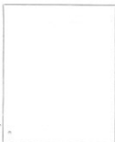
Fotografía tomada en el mes de ..... de 1.....