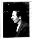
Fotografía tomada en el mes de ..... de 1.....