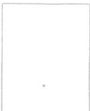
Fotografía tomada en el mes de ..... de 1.....