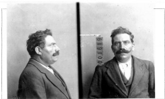
Fotografía tomada en el mes de _____ de 1 _____