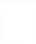
Fotografía tomada en el mes de _____ de 1 _____