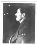
Fotografía tomada en el mes de _____ de 1 _____