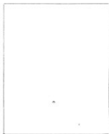
Fotografía tomada en el mes de _____ de 1 _____