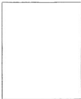
Fotografía tomada en el mes de ..... de 1.....