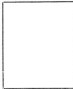
Fotografía tomada en el mes de _____ de 192_____