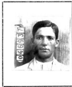
Fotografía tomada en el mes de Agosto 31 de 1925