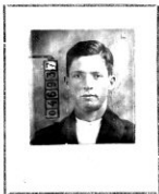
Fotografía tomada en el mes de Octubre 15 de 1924