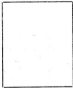
Fotografía tomada en el mes de _____ de 192 _____