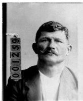
Fotografía tomada en el mes de enero de 1919