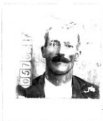
Fotografía tomada en el mes de Agosto 31..... de 19 45