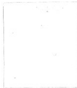
Fotografía tomada en el mes de..... de 1.....