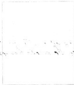
Fotografía tomada en el mes de..... de 1.....